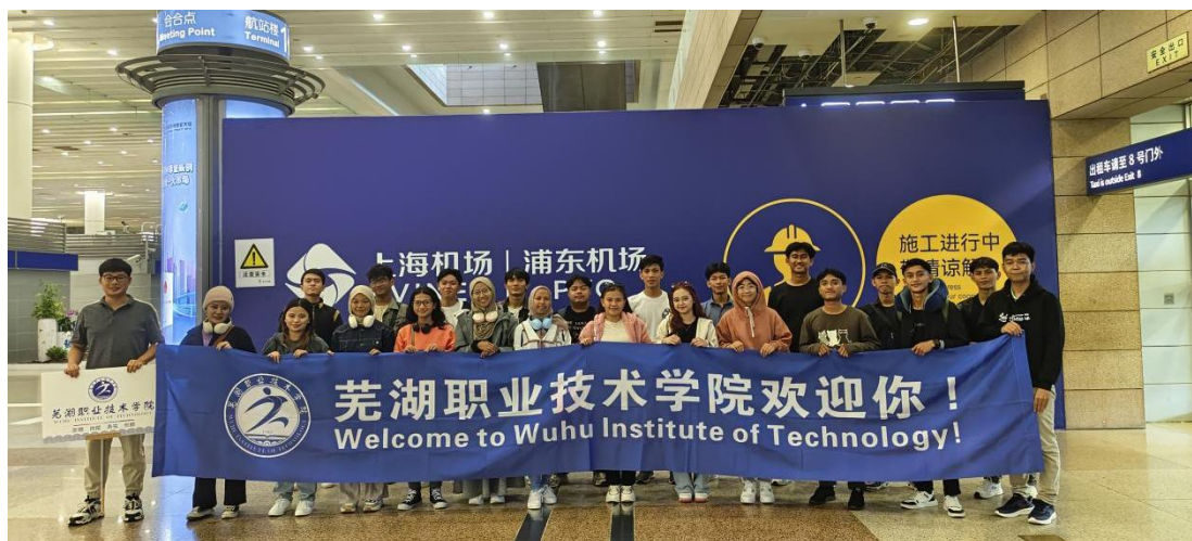
图2 第三期国际订单班学生

学校自2019年开始接收海螺选送的优秀印尼籍学生来校接受全日制学历教育，打造“订单式”培养，将企业需求与优势专业学科配对。采用“中文+职业技能”人才培养模式，并组织学生赴企业实践，适应企业管理；开展中华文化（徽文化）系列体验活动，让留学生充分了解中国基本国情，感受中华优秀传统文化。