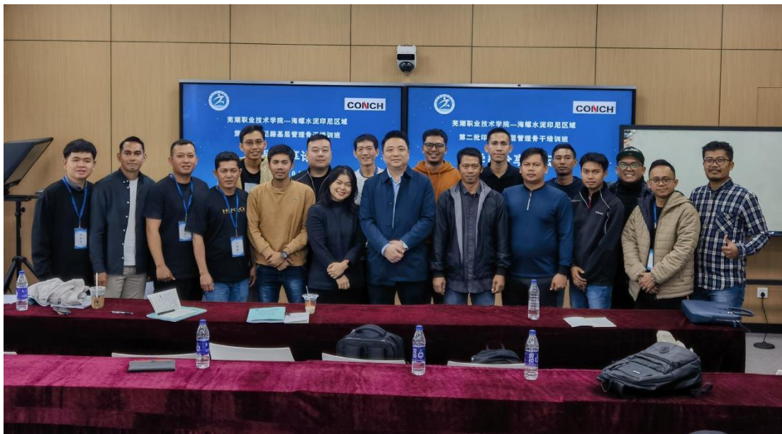
图 4 第二批印尼籍基层管理骨干培训班企业专家授课