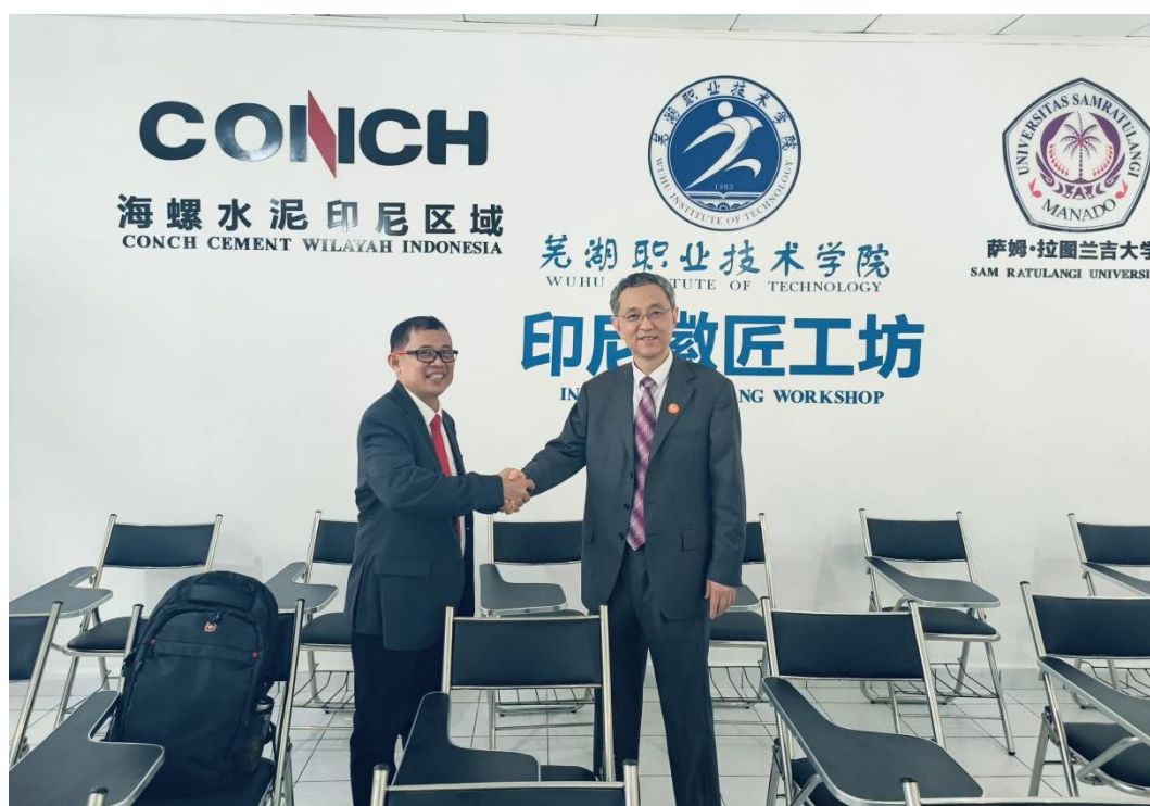
图 3 徽匠工坊揭牌运营

所徽匠工坊在印尼美娜多萨姆·拉图兰吉大学正式揭牌运营，一期建筑面积达 240 平方米。学校同时在萨姆·拉图兰吉大学成立首所海外分校。学校定期对徽匠工坊和印尼分校建设展开评估，适时调整“国际订单班”的运营管理及保障体系，不断完善校企合作国际化人才培养新模式。