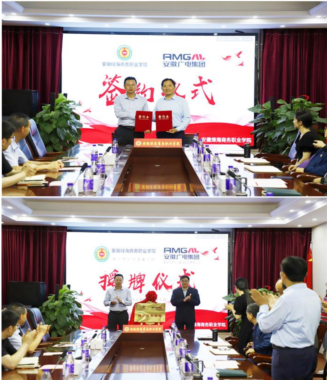
图 1：安徽绿海商务学院与安徽广电集团签约揭牌仪式