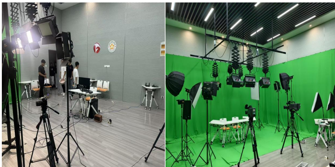
图 4：依托安徽广电专项资金建设的直播电商项目实战基地

包括 4K 超高清直播系统、虚拟演播系统、智能剪辑平台等，这些设备不仅用于教学实训，还承接企业真实项目，实现了"教学做"一体化。特别值得一提的是安徽绿海融媒体中心，是由绿海学院携手安徽广电集团倾力共建的现代化融媒体中心。中心装配了一套全面且尖端的灯光影视系统，专业的电影机、摄像机以及先进的直播系统，这一系列高精尖设备共同构成了融媒体中心强大的技术支持体系。