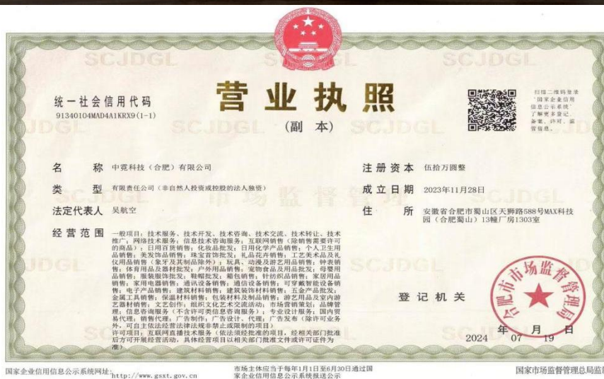
图 5: 部分学生自主创业的营业执照