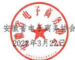
图 3: 安徽省电子商务协会感谢信