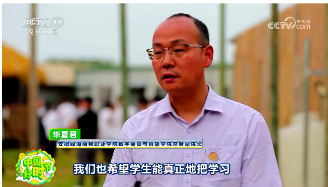
图 9：助农活动获中央电视台宣传报道