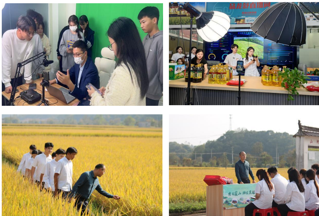
图 7：学生在校外实训基地真实项目实践

学院依托安徽广电集团的行业优势，积极对接地方政府部门和区域优质企业资源，共同打造了多个校外农村电商直播实训基地。（图6）通过系统引入企业真实运营项目，为学生构建了乡村电商实战场景，有效打通了从课程学习到岗位实践的转化路径。该机制显著提升了学生的职业适应能力与综合素养，实现了从“学生”到“准员工”的角色平滑过渡，最终有力支撑了毕业生高质量就业目标的达成。