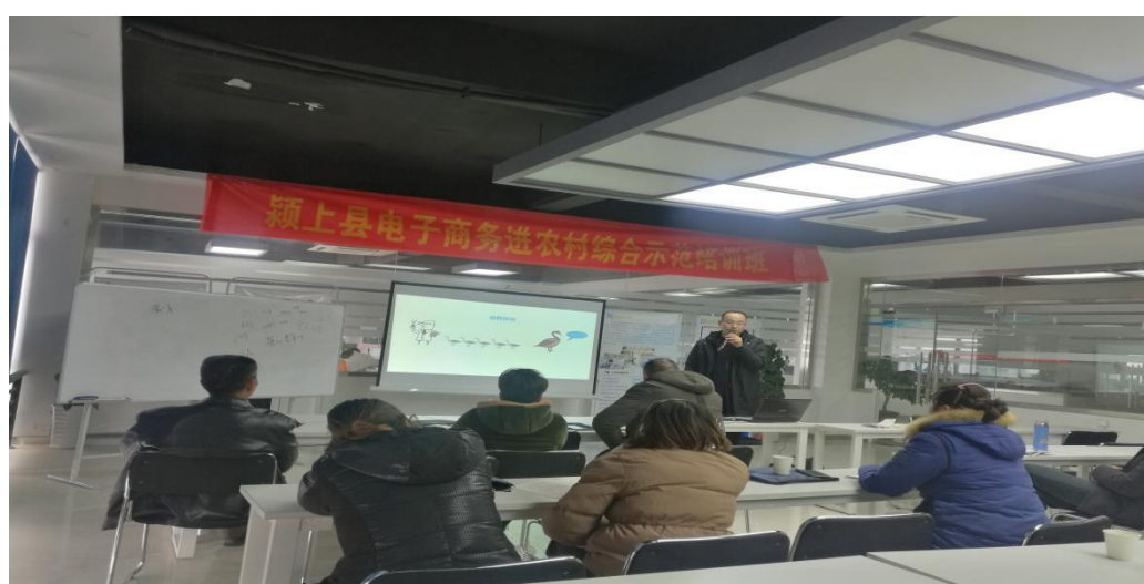
图 10：安徽绿海商务职业学院教师团队开展直播助农乡村振兴帮扶培训