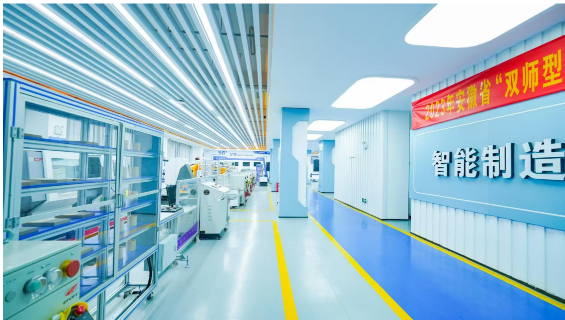
图1 智能制造创新工厂（实景图）

与芜湖国家机器人产业集聚区、机器人产业链龙头企业、科研院所共建了智能工厂，涵盖了工业机器人、协作机器人、复合机器人等在高端数控装备、智能物流、精密检测、智能焊接、智能喷涂等制造多领域中的应用，呈现了工业机器人、机器视觉应用、工业互联网等多元化的应用。智能工厂项目涵盖智能装备、工业软件、工业互联网等，重点聚焦大数据采集系统、自动化设备联调等应用领域。真实还原智能工厂仓储、AGV搬运、加工、智能检测等智能产线的生产环节，进行岗位实境教学，服务工业机器人专业群智能制造高技能人才培养，智能制造创新工厂如图1所示。