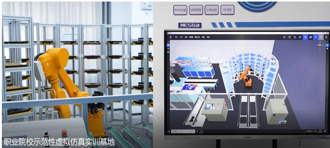
图 3 开发的数字孪生的教学资源(仓储自动化单元)