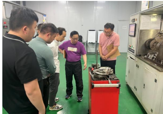
企业产品研发现场

学生在真实的工作环境中学习专业课，内容不再局限于书本。企业导师定期给学生开展专业讲座，进行典型案例分析，并把先进的一线生产经验和技术要求带入课堂。学生毕业设