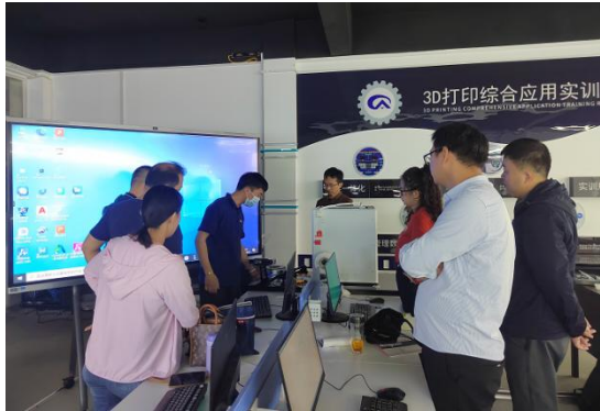
校企共同商讨课程项目化

学校基于各专业的实际情况，遴选与之相匹配的企业产教融合项目。进一步优化课程体系，增设专业选修课，每个专业与企业共同开发2-3门课程。