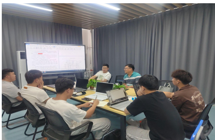
三年级学生参与企业产品设计

校企共同成立产教融合工作室。企业参与人才培养方案制定，明确培养岗位目标，从用人单位的角度为学生