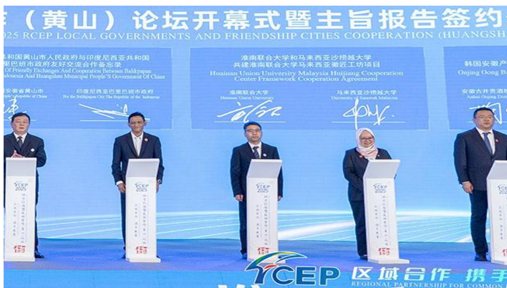
图 9. 我校与马来西亚沙捞越大学在黄山“RCEP 地方政府暨友城合作论坛”开幕式上共同签署共建“马来西亚徽匠工坊”协议