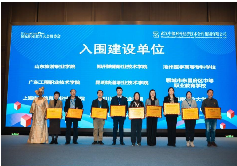
图7. 我校被评为乍得国家职业标准开发项目优秀建设单位

学校凭借在药学专业领域的积累，积极参与教育部“乍得国家职业标准共建互认项目”，独立、自主开发了“药品生产工艺管理员（5级）”职业标准。该标准在全国53项乍得国标开发项目中脱颖而出，学校被评为“优秀建设单位”（见图7），并收到乍得国家的感谢信（见图8）。这标志着学校的专业建设成果得到了国际官方认可，实现了从“学习者”到“标准贡献者”的角色转变，为中国职教标准走向世界做出了实质性贡献。