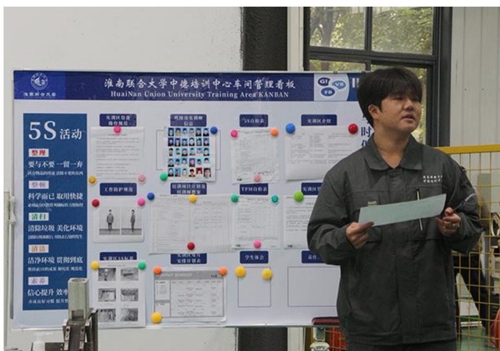
图 1. 中德双元制班学生在上课

设计“多情景任务”，引导学生经历“资讯、计划、决策、实施、检查、评价”六环节，实现“做中学、学中做”；资源上，引进并合作开发符合德国标准的活页式教材和工作页，使学习内容模块化、动态化；机制上，积极对接德国工商大会（AHK）等机构，加入 AHK 德国双元制职业教育联盟，并挂牌成立“中德（淮南）培训中心”（见图 2），为学生获取国际认可的职业技能证书创造条件。