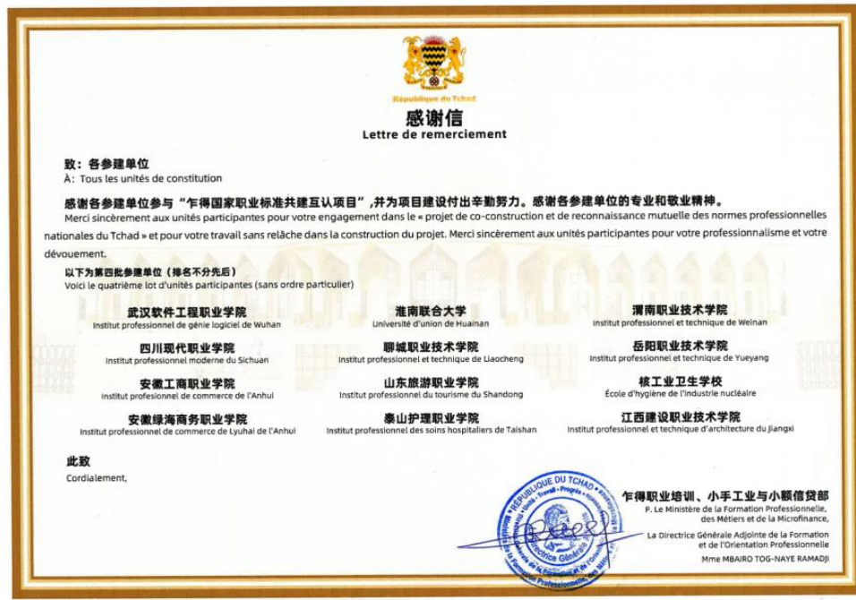
图 8. 我校获赠乍得国家给予的“感谢信”