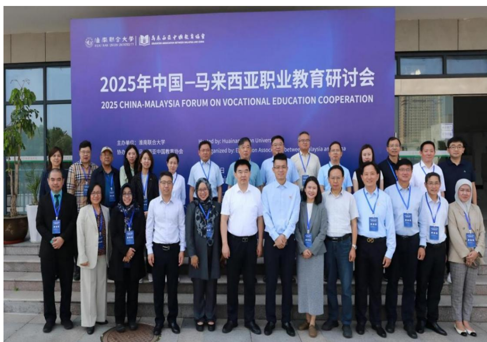
图 4. 淮南联合大学主办“中国—马来西亚职业教育研讨会”

为提升学校学术影响力和获取前沿教育信息，淮南联合大学于 2025 年主动策划并成功主办了“中国—马来西亚职业教育研讨会”（见图 4）。会议吸引了中马两国十余所高校的百余位代表，围绕国际化人才培养、产教融合等议题进行深入研讨。以此为契机，学校挂牌成立了“马来西亚沙撈越大学—淮南联合大学国际合作中心”（见图 5），同时，首次聘任 4 名马来西亚沙撈越大学的学者为客座教授（见图 6），建立起了稳定的外籍专家参与学校教学、科研和师资培训的机制。