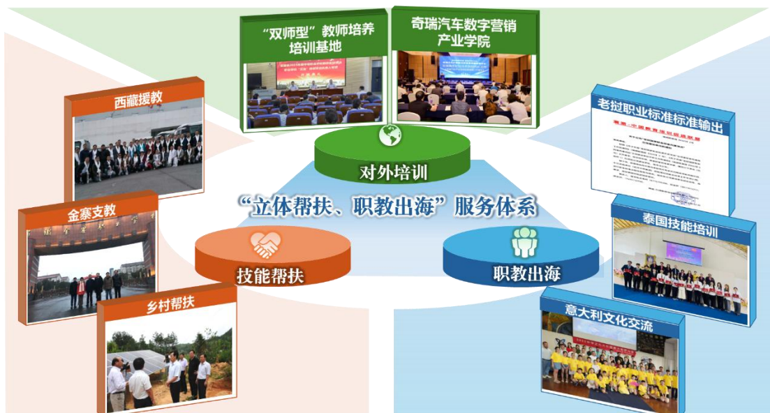
图4 “立体帮扶、职教出海”服务体系