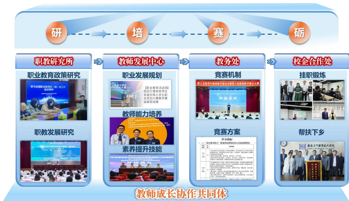
图3 “聚力同行、多维发展”实施路径