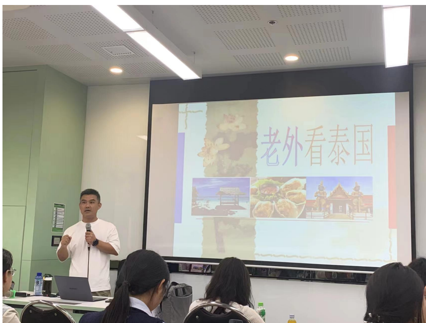
泰国正大管理学院为交换学生定制课程《中泰文化比较》

1. 定制化课程设计。根据学生专业方向，联合泰国正大管理学院定制课程包，涵盖“专业核心课+国际技能课+跨文化素养课”三类模块。如，为空中乘务专业安排航空模拟舱实训，对接国际服务标准；为所有学生开设《中泰文化比较》，解析两国教育、产业差异。