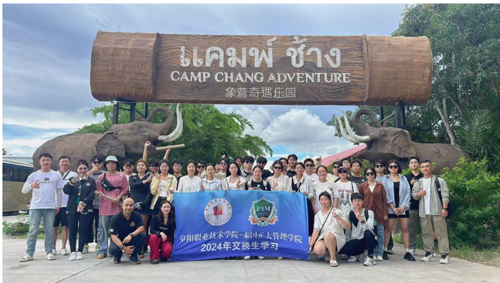
交换学生实地探访泰国本地文化

2. 人文风景实地探索。设计“文化探访路线”，组织学生走访七珍佛寺、芭提雅水上市场、真理寺。鼓励学生记录“文化日记”，累计形成 30 余篇图文笔记，在校内新媒体平台连载，带动更多学生了解泰国文化。