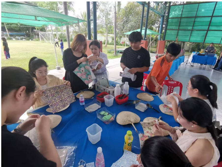
交换学生走进芭提雅儿童保护发展中心与中心儿童一起做手工

2. 沉浸式公益实践开展。2024年8月17日，组织学生与中心儿童开展“暖心互动”，一起制作手工、开展篮球友谊赛等活动。活动后，学生互赠礼物，传递善意。