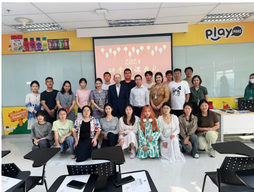
正大管理学院为交换学生颁发结课证书

3. 课程互认与成果转化。将学生在泰所学课程纳入校内学分体系，50 余名学生均通过课程考核，其中 8 名学生的实训报告被评为“优秀案例”，在校内专业教学中作为示范材料分享。