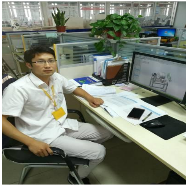
图5 金纬常州公司技术部部长

20年来，约300多名金纬班学子输送到金纬各公司，成为公司的技术和管理骨干，为金纬公司做大做强发挥了重要支撑。