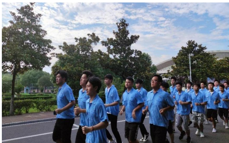
图2 三年如一日在驻校班主任带领下晨跑

金纬公司的企业文化精粹是“用心持久，诚实待人”。正是秉持这个理念，每年新生入学组班时即约法三章：每天坚持晨跑，每天必须在班级晚自习。看似严苛的班规却一举