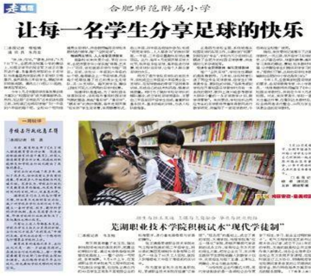
图4 《安徽青年报》关于“金纬班”现代学徒制的报道

20年来，约300多名金纬班学子输送到金纬各公司，成为公司的技术和管理骨干，为金纬公司做大做强发挥了重要支撑。