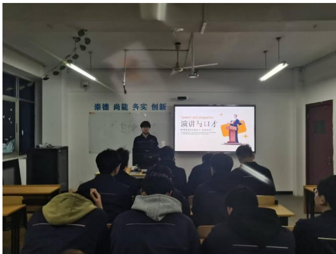
图3 演讲比赛提升沟通表达能力和自信心

金纬班通过组织全员演讲比赛等方式培养学生的语言表达能力。金纬班一直把交流沟通能力视为个人综合素养的重要体现和职场的一项关键技能。良好的演讲与口才能力能够提升个人的自信心和魅力，通过清晰、流畅且富有感染力的表达，个人能够更有效地展示自己的想法、观点和才能，从而在社交等各种场合中脱颖而出，获得更多的认可和机会。