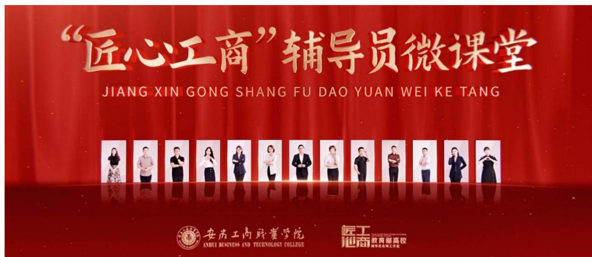
图4 匠心·辅导员（理论宣讲）微课堂

（3）“匠心·辅导员微课堂”精准赋能，理论宣讲内涵显著提升。学校聚焦学生成长需求，创新构建“理论精讲+工具模型+实操锦囊”三维课程，已录制系列微课13部，总时长130余分钟，全网播放量突破2万次，显著提升了思想引领的针对性和实效性。