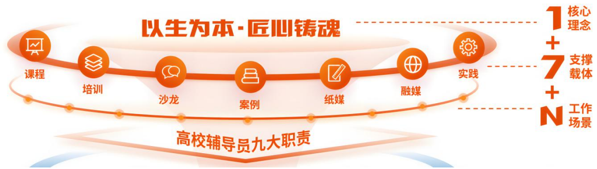
图2 辅导员队伍“1+7+N”立体化赋能体系