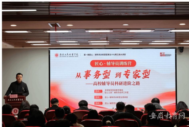
图 5 省级主流媒体报道学校辅导员队伍建设工作情况

12月24日下午，安徽工商职业学院智慧思政实践教学基地红色报告厅内气氛热烈，学校第一期“匠心·辅导员训练营”暨第五十七期“工商大讲堂”隆重举行。本次活动由学校教育部“匠心工商”辅导员名师工作室牵头承办，并联合安徽理工大学（合肥校区）、安徽国际商务职业学院、安徽新闻出版职业技术学院共同协办。安徽工商职业学院校领导、四所学校学工部门负责人、部分二级学院党政领导及专职辅导员代表近百人齐聚一堂，围绕辅导员队伍专业化、专家化发展路径，开展深入研讨与交流，共同描绘新时代高职院校思政工作高质量发展新图景。