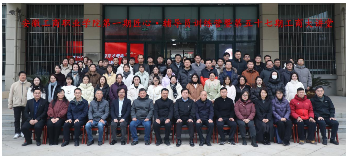
图3 匠心·辅导员（校际）训练营

（3）“匠心·辅导员微课堂”精准赋能，理论宣讲内涵显著提升。学校聚焦学生成长需求，创新构建“理论精讲+工具模型+实操锦囊”三维课程，已录制系列微课13部，总时长130余分钟，全网播放量突破2万次，显著提升了思想引领的针对性和实效性。