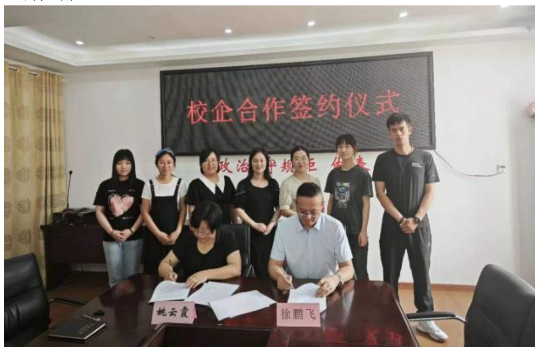
图 1: 校企双方签约仪式现场

为落实国家深化产教融合战略，推动教育、人才、产业与创新链衔接，我院将校企合作视为提升办学和服务能力的关键。依托行业龙头企业资源，构建人才培养体系，提供产业贴近的学习环境。合肥丰盈消防技术有限公司是消防技术服务标杆，具备国家一级资质，业务涵盖检测、维护、评估、设计施工、设备制造及技术服务。基于共同愿景，双方于2023年6月签署合作协议，聚焦建筑消防技术专业，打造实习实训、研发、定向培养的协同平台，实现资源共享、优势互补、互利共赢。