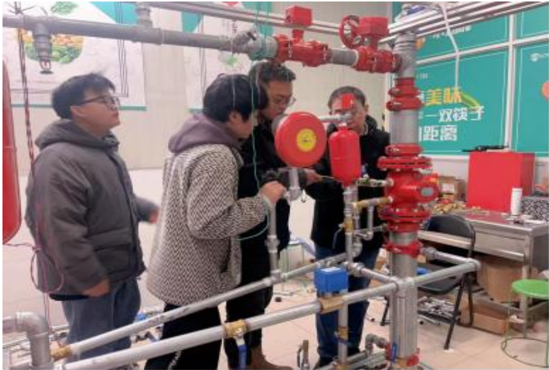
图 4：师生在企业实践基地开展教学活动