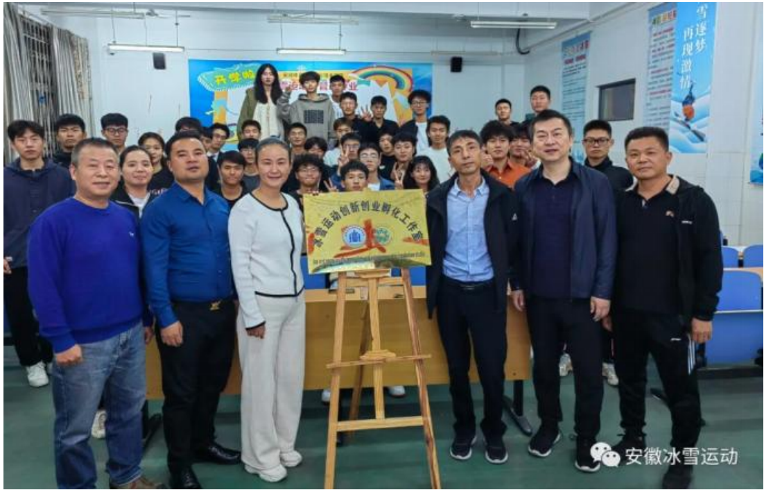
图3 校企联合创建“创新创业孵化工作室”