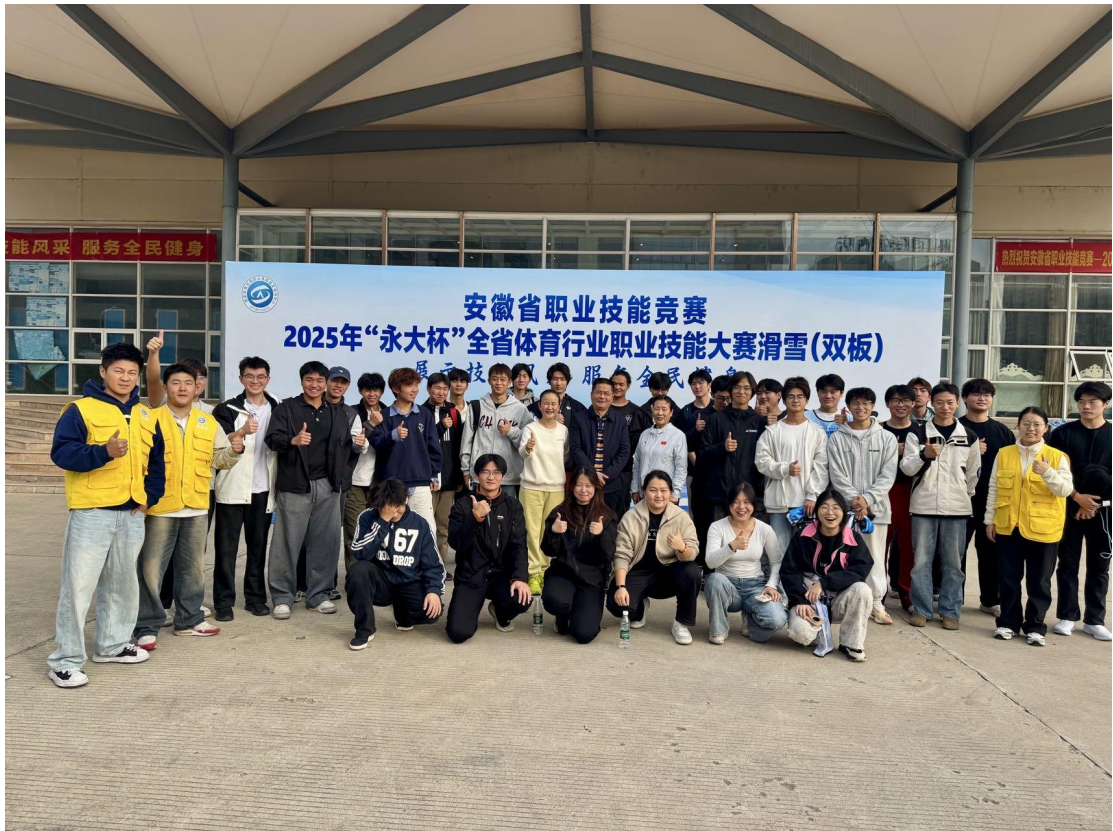
图4 校企联合带领学生参加安徽省职业技能竞赛—2025年“永大杯”全省体育行业职业技能大赛滑雪（双板）获得4个一等奖