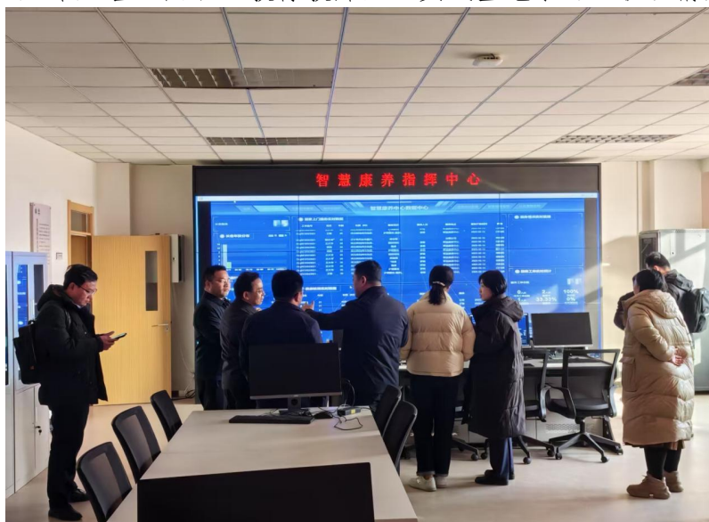
(教师参观天津天堰智慧养老指挥中心)