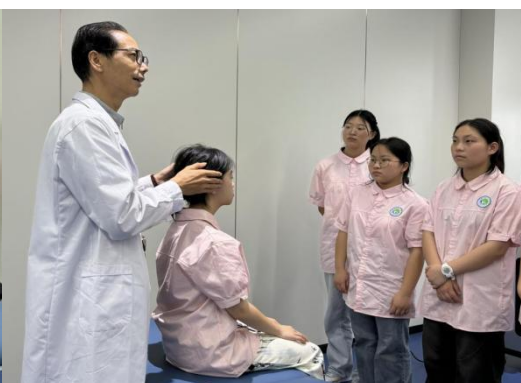
（企业导师进行中医康复技术实践教学）