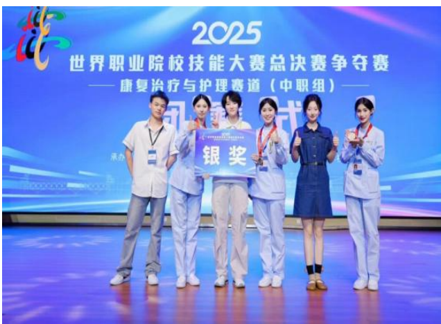
（学生在世界职业院校技能大赛总决赛争夺赛中获铜奖、银奖）