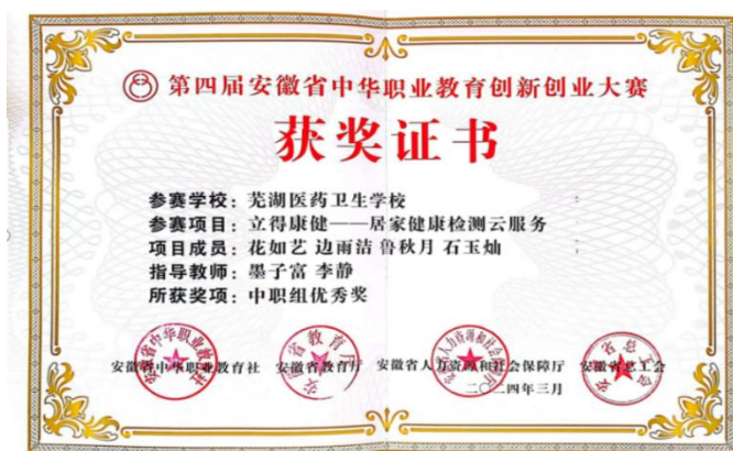
（学生获安徽省中华职业教育创新创业大赛中职组优秀奖）