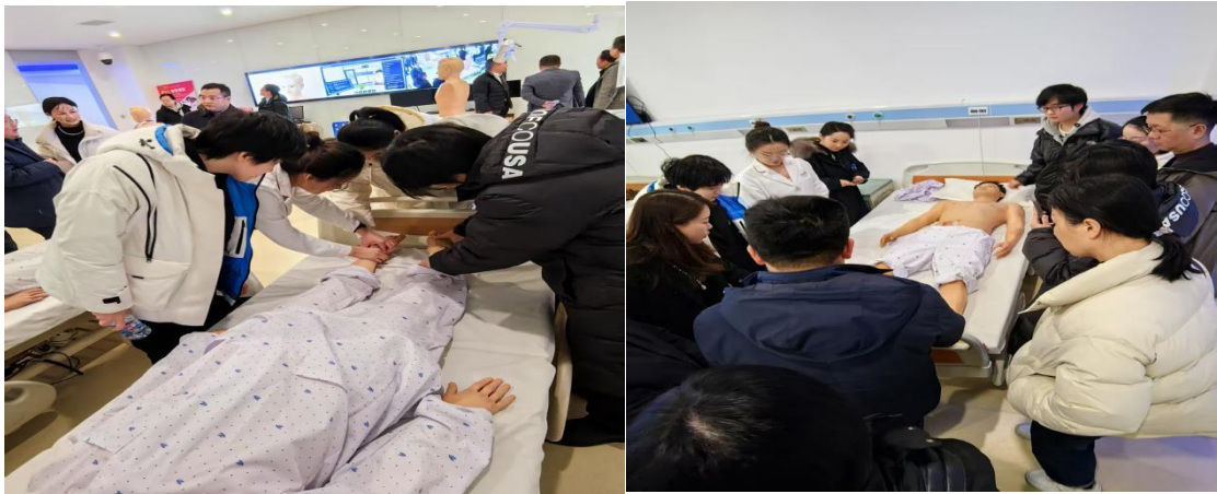
(教师在天津天堰全国职业教育教师企业实践基地学习—护理情景模拟)