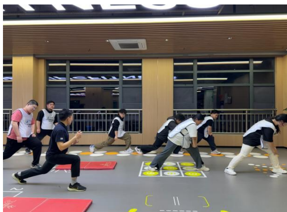
（学生在产业学院基地进行体质监测和健康减重训练）