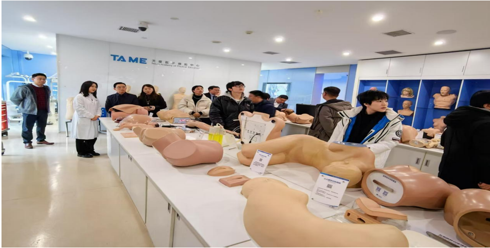
(教师在天津天堰医学模拟中心学习)