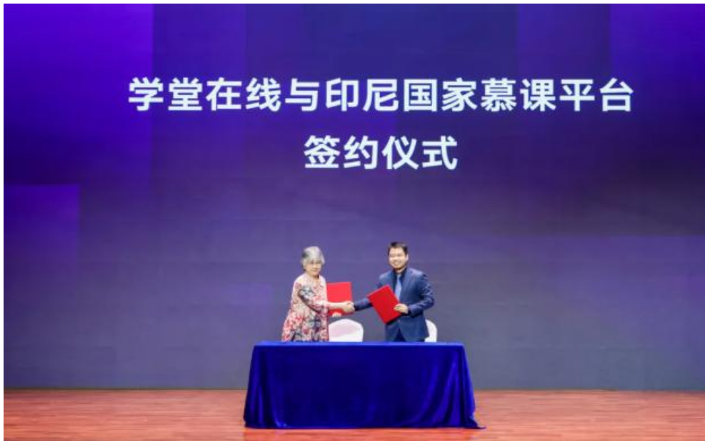
学堂在线与印尼网络教育学院签署大规模开放在线教育合作协议 XuetangX and Indonesia Cyber Education Institute Sign MOOC Cooperation Agreement