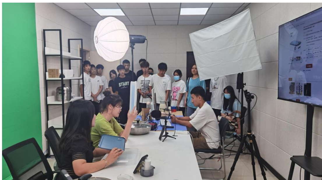
图1 双创班学生演练实操

设置初中高三级项目，遵循企业真实项目管理体系完成项目实战，企业在培养过程中导入企业文化、职业素养及立德树人等素质教育，培养德智体美劳全面发展的社会主义建设者和接班人，建立全方位全过程的育人评价体系，最后依托企业产教融合实习实践基地完成真实企业环境下的项目实战，打通学生就业最后一公里职业综合能力的培养。