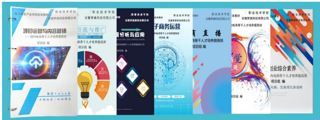
图 2 开发校本教材

校企在梳理总结产教融合、校企合作各阶段所积累的经验与教训的基础上，积极推进学生招募标准化、培训实施标准化、实操过程标准化和评估方式标准化，基于梦森智慧实训云平台及企业钉钉学习云端，帮助师生随时随地开展学习和实训，显著提升了实训教学的效果。