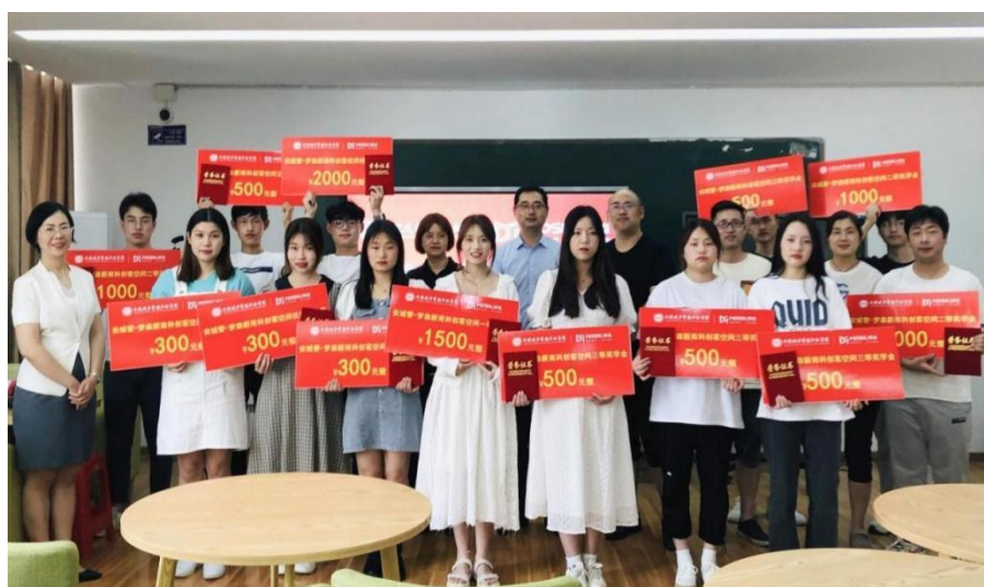
图 5 双创班优秀学生颁奖仪式

根据学校提出的“严格落实新商科人才培养目标和培养规格要求，加大过程考核、实践技能考核成绩在课程总成绩中的比重。严格考试纪律，健全多元化考核评价体系，完善学生学习过程监测、评价与反馈机制，引导学生自我管理、主动学习，提高学习效率”的具体要求。企业充分结合企业对电子商务主要岗位人员工作绩效考核及高等职业院校对学生课程学习效果考核进行了考核评价方式的改革，培养出一批具有专业实战能力的优秀学生。