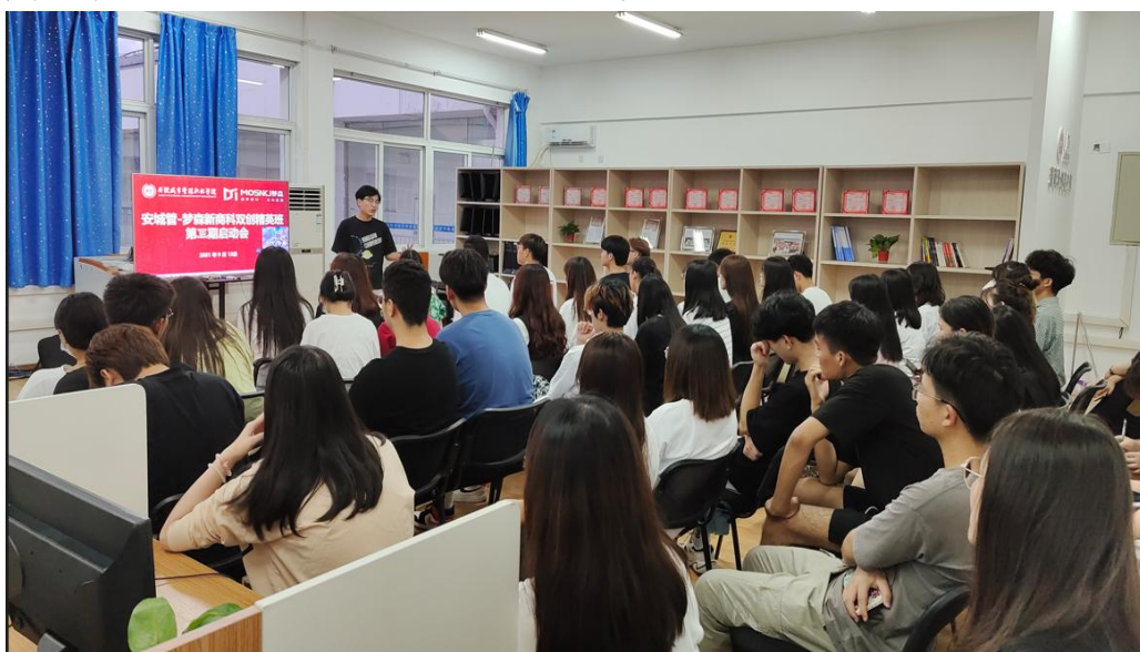
图 3 企业导师项目培训

校企积极邀请省内外双创教育专家、企业家、风险投资人、专业培训师和高校优秀教师等各领域的优秀人才，以专职、兼职相结合的方式为学生开展校企合作、产教融合和双创教育方面的讲座、沙龙及培训。