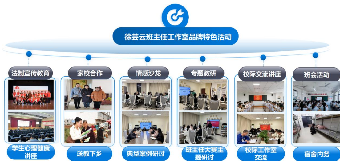
图5 工作室品牌特色活动图