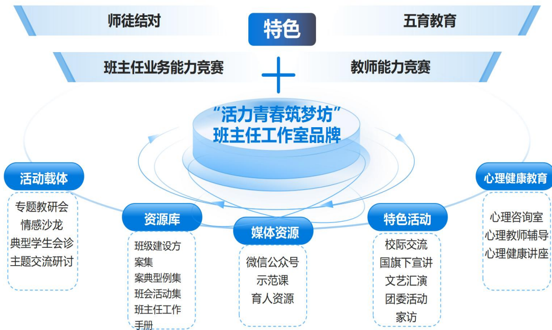
图1 “活力青春筑梦坊”品牌特色图

工作室创建“活力青春筑梦坊”班主任工作室品牌，通过构建《活动载体品牌链》、《资源库内容清单》、开展校际交流活动等，发挥品牌建设的具体举措与成效。“活力青春筑梦坊”品牌已成为工作室对外展示的重要窗口，有效提升了工作室的社会影响力。