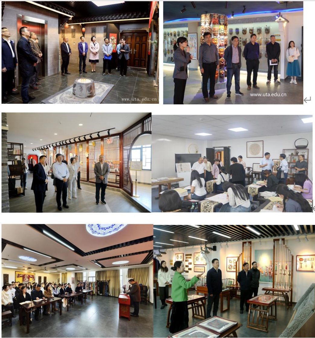
图 1. 师资队伍接待各级领导现场指导（节选）