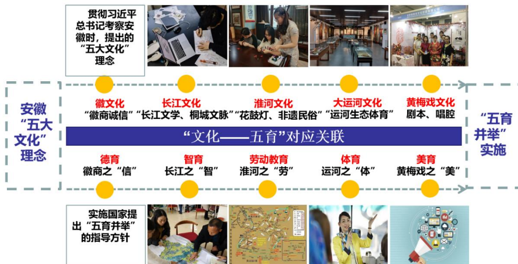
图 2. “文化-教育”双向赋能理论框架

徽商文化之“信”与“德育”：徽商核心精神“诚信为本、以义取利”，与职业教育德育中要求的职业道德、工匠精神、社会责任高度统一。以此为纽带，培养学生的职业操守和守信践诺的品格。