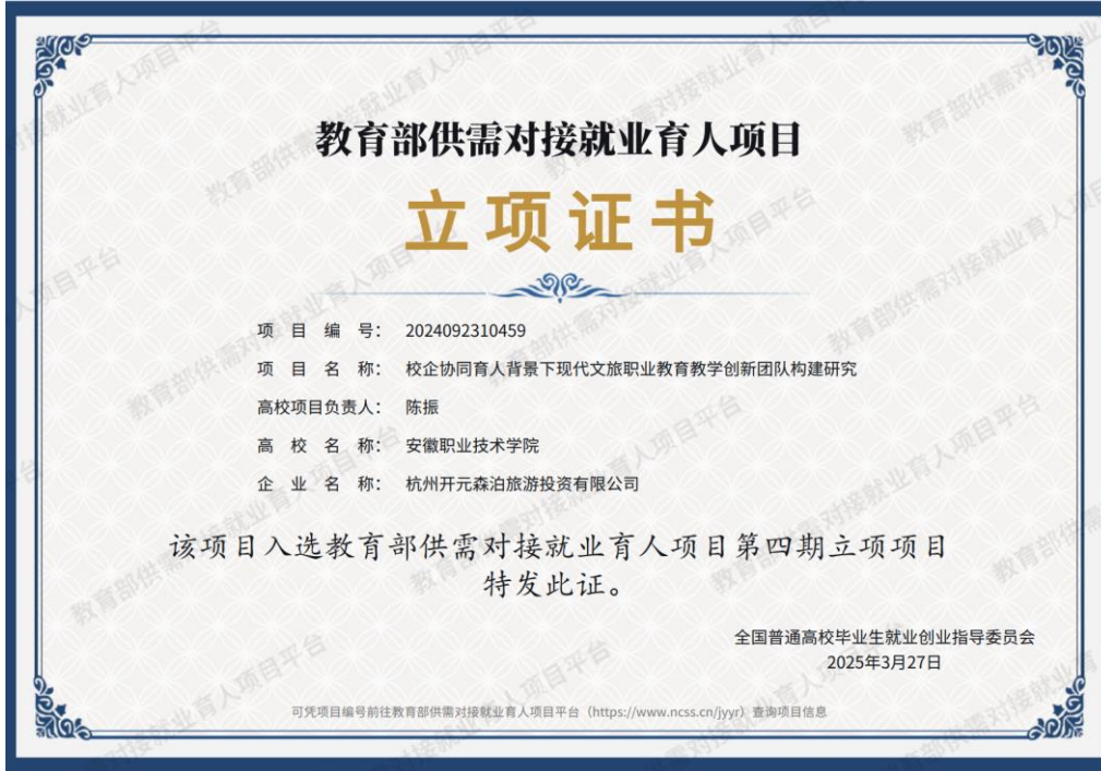
图4. 师资队伍建设成效