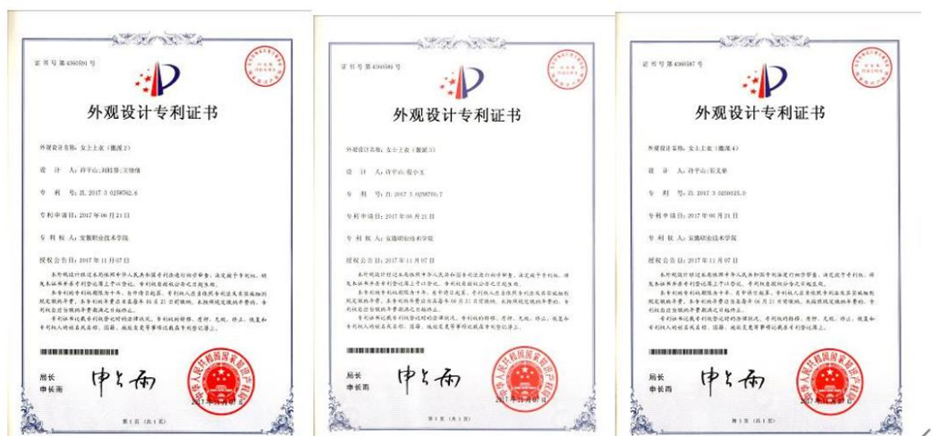
图 4. 基地国家级荣誉及专利（节选）