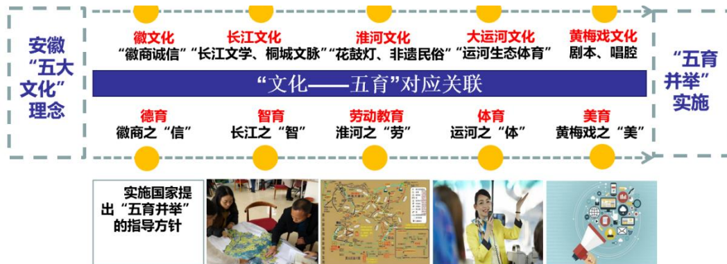
图 1. “五大文化——五育并举”文旅职业教育与研究体系

容与岗位工作相连。构建“五大文化——五育并举”双向赋能的文旅职业教育与研究体系。