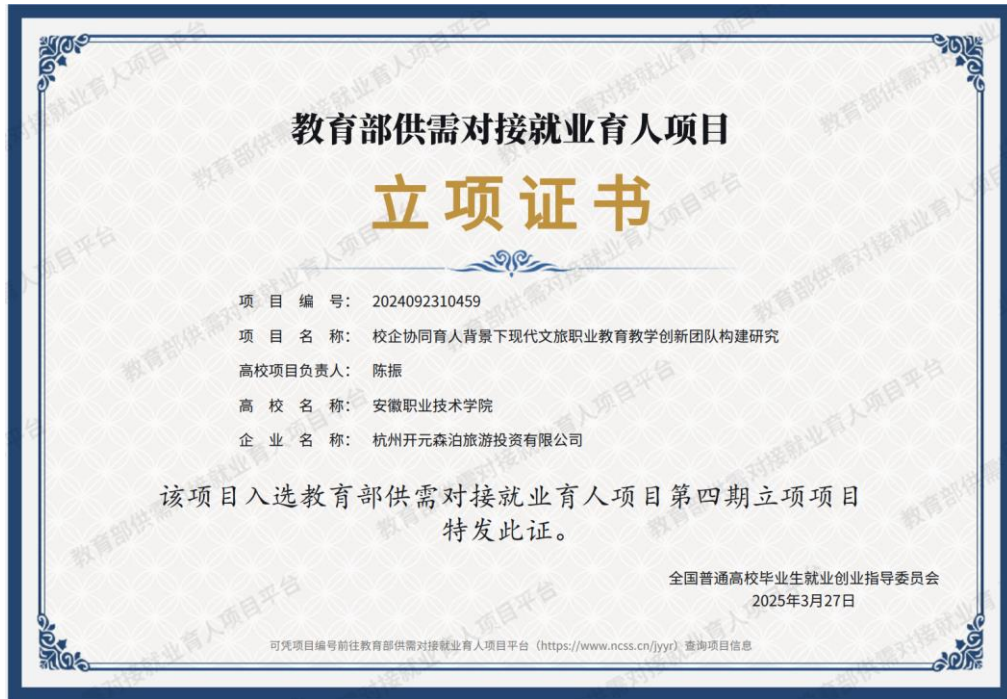
图 2. 校企共同申报教育部育人项目，共建国家级文旅教学创新团队